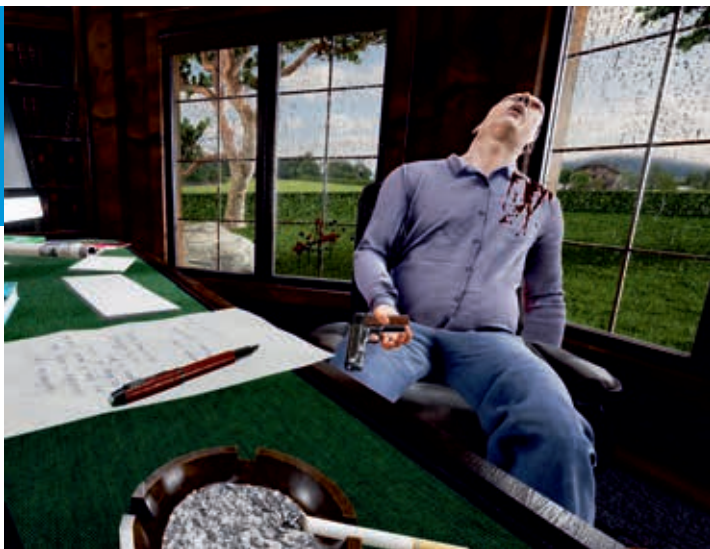
Wirtualna rzeczywistość, w której studenci - w goglach VR - przeprowadzają oględziny miejsca przestępstwa