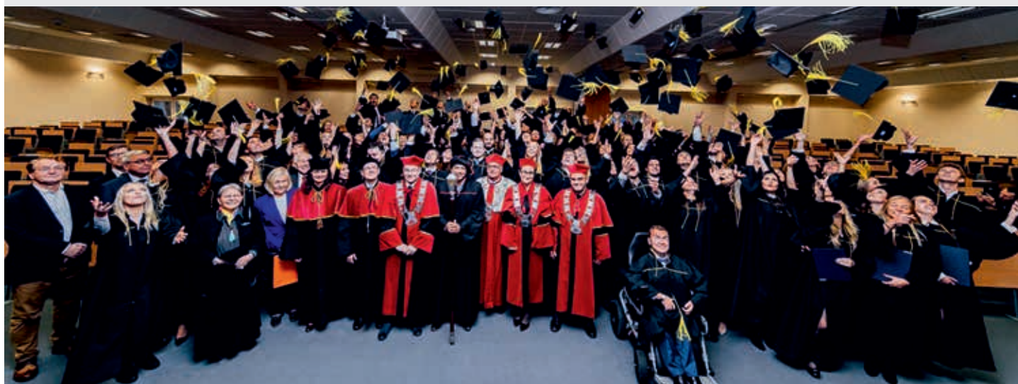
Uroczystość wręczenia dyplomów magisterskich absolwentom prawa 2017

Ponadto w dobie specjalizacji stopień naukowy daje przewagę konkurencyjną na krajowym oraz międzynarodowym rynku pracy.