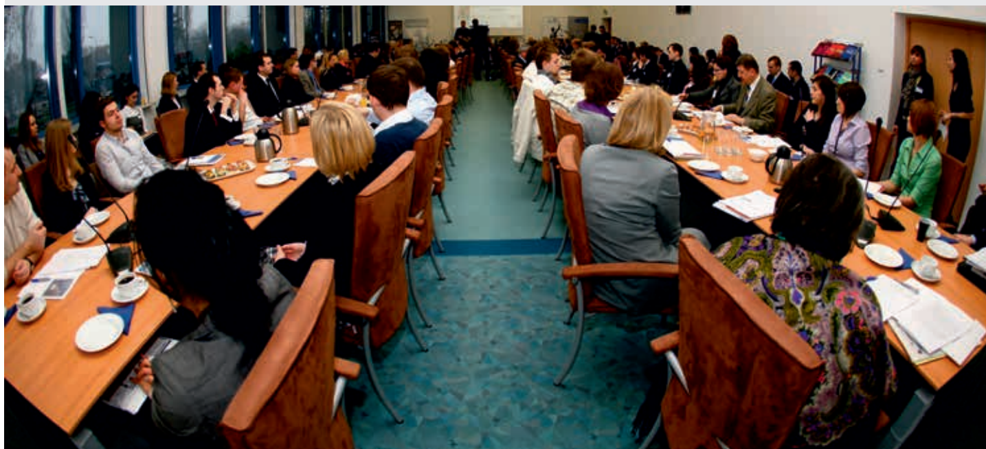
XIII Konferencja Studenckich Poradni Prawnych

Kolegium Prawa od 2009 roku wydaje czasopismo naukowe „Krytyka Prawa. Niezależne studia nad prawem”, którego celem jest dokonywanie diagnozy i ocena zachodzących zmian prawa w Polsce, Unii Europejskiej i na świecie. Czasopismo ukazuje się w formie nowoczesnego kwartalnika naukowego i znajduje się na liście czasopism punktowanych publikowanych przez Ministerstwo Nauki i Szkolnictwa Wyższego w części B.