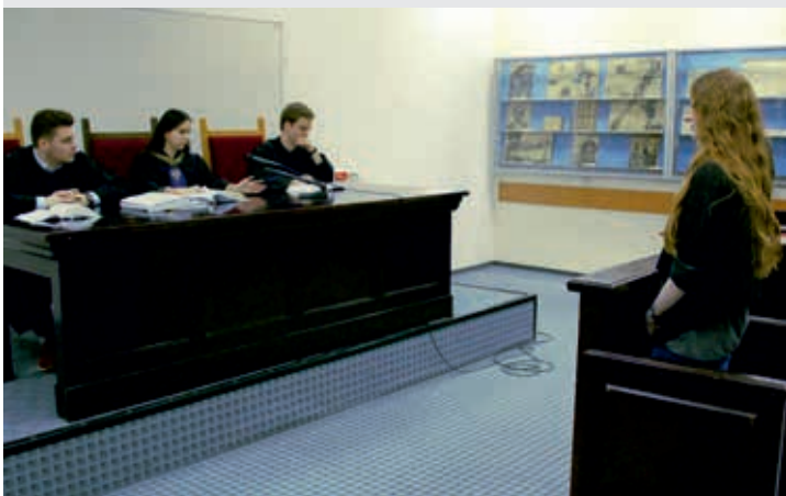
Symulacja rozprawy sądowej